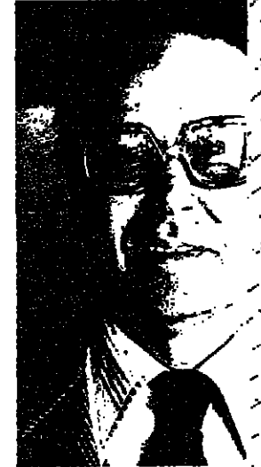
ساعدتنا في إقامة رياضة بين ناد اسرائيلي ي . الزملاك او الاهلي

ارة التي قام بها السيد سفير مصر لدى مكاتب صحفية في اورشليم القدس ٤ السؤال التالي : عادة السفير على